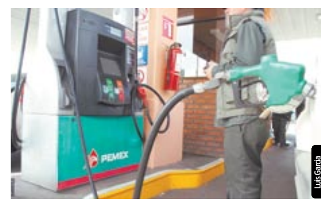
Según reforma energética, en el 2014 concluyen gasolinazos.

ser especial y lo va a fijar la Secretaría de Hacienda en cada contrato dentro del marco legal general de la Ley de Hidrocarburos. Aplicaría igual para Pemex”, señaló el funcionario. En algunas modalidades de contrato, se les permitirá recuperar costos, conforme lo estipule el contrato y en apego a prácticas internacionales, aseguró. Las opciones son hacer una lista de lo que sí se puede recuperar o poner un techo límite. Para vigilar el pago y el cumplimiento, los contratos se harán públicos, excepto temas relativos a secretos tecnológicos y costos de las empresas. Se incluirá una cláusula donde las firmas deberán de dar a conocer los pagos que realicen al Estado y los ingresos que reciban por la actividad. A su vez, el Gobierno deberá publicar sus costos, ingresos y gastos respectivos. Los contratos serán auditados por entidades externas y el procedimiento licitatorio estará vigilado por varias entidades de Gobierno. - AGENCIA REFORMA