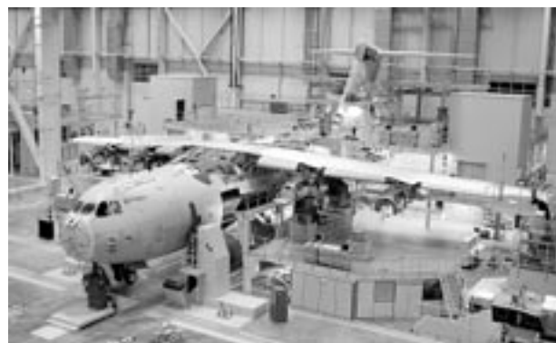
En BC hay varias empresas enfocadas a esta industria.

“El objetivo es que para el 2014 se este en 4 mil millones de dólares en las operaciones de valor comercial de impor-