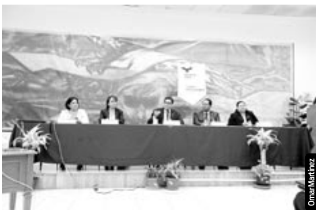
La PDH llevó a cabo una conferencia magistral el lunes.