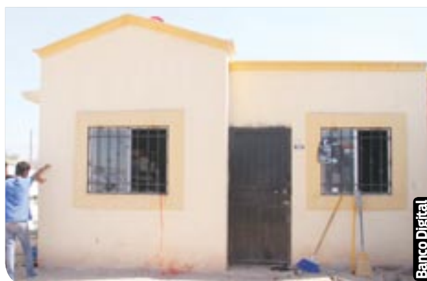
Un niño de 5 años de edad, resultó con heridas leves luego de que su domicilio se incendiara.