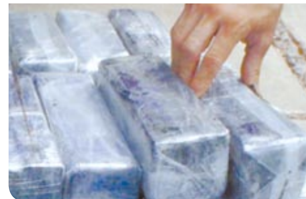
Los paquetes fueron encontrados en un compartimento secreto del tráiler.