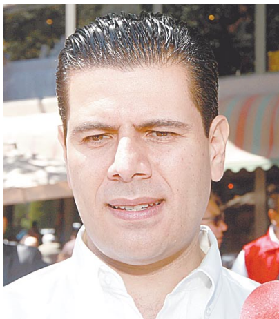
Miguel Alonso Reyes, Gobernador de Zacatecas.