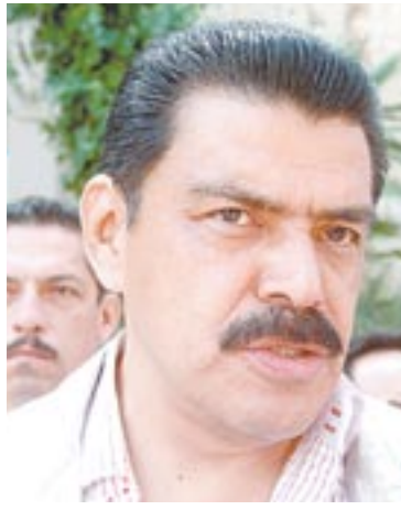
Francisco Olvera Ruiz, Gobernador de Hidalgo.