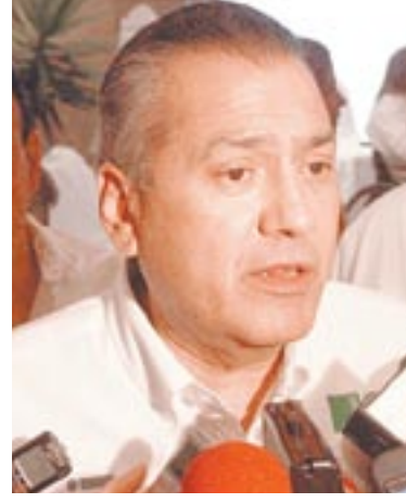
Manlio Fabio Beltrones, diputado federal.