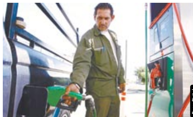
El subsidio en los precios del combustible sería de 48 mil mdp.

Es decir, que a falta de dos tercios de que concluya el año, prácticamente ya se erogó el total de estos recursos