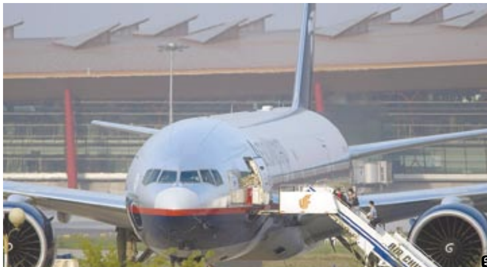
De estallar la huelga, serían unas 380 operaciones diarias las que se suspenderían.