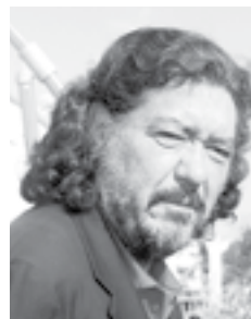
Jorge Hank Rhon

La presencia del polémico empresario y ex alcalde de Tijuana, Jorge Hank Rhon , llamó la atención, cuando de repente apareció con su peculiar estilo en el que sobresalía su barba larga y en cuanto pisó la explanada de la Plaza Monumental, se hizo referencia de que acababa de llegar.