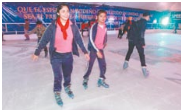
La pista estará abierta del 13 de diciembre y hasta el 13 de enero y es sin costo.

virtiendo, en general toda la familia se venga a divertirse a patinar a pesar de que esta en Tijuana pero también puede venir la gente de Tecate y Rosarito”, indicó.