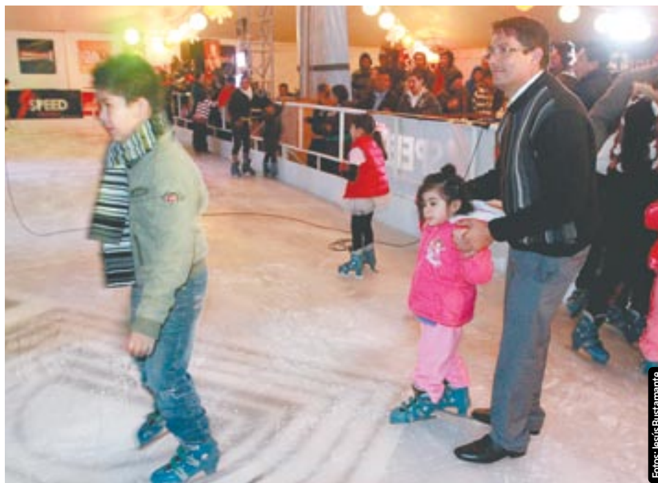
La pista de hielo más grande del Noroeste fue inaugurada la noche del jueves en las inmediaciones de Centro de Gobierno.

“Es para que se diviertan los niños, de hecho, aquí tenemos a niños del albergue que se están di-