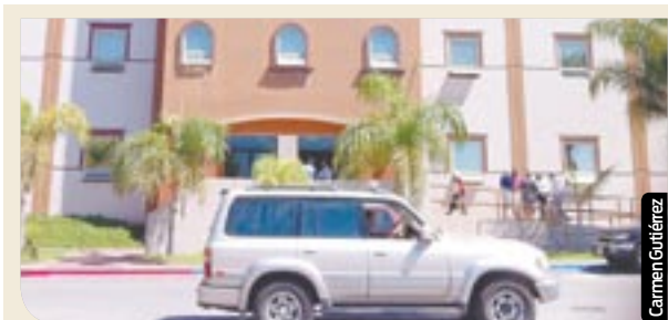
Ayuntamiento de Rosarito.