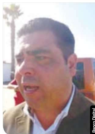
Roberto Perales, Síndico Procurador de Rosarito.

De acuerdo con el Síndico Procurador de Rosarito, Roberto Perales, las quejas hacia los policías municipales han disminuido al menos en un 30% durante este año, en comparación con el 2011.