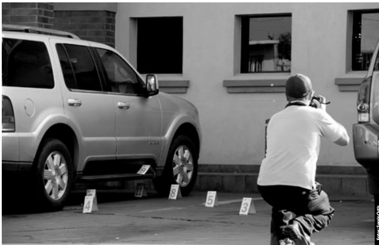
La tarde del viernes se registraron detonaciones de arma de fuego en el estacionamiento de un restaurante.

Correo electrónico: denuncia.28bi@sedena.gob.mx