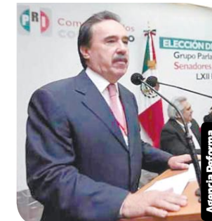
Emilio Gamboa Patrón.

Además el Senado recibió también el acuerdo de la cámara baja por el que manifiesta su aceptación para que el decreto de la reforma laboral se “pueda formar únicamente con los artículos