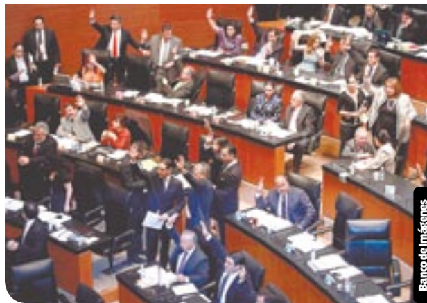
El bloque del PRI se abstuvo de votar en la primera terna.