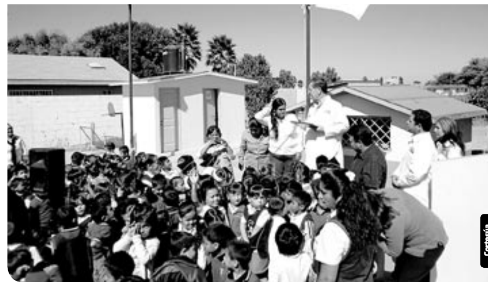
En lo que va del año se han incorporado al programa 197 Escuelas a nivel estatal.

Esta certificación, señala un comunicado de la Secretaría, consiste en que todas las familias, o alumnos en el caso del plantel escolar, tienen su cartilla Nacional de Salud, cumplen con todo lo que marca la norma 093 en materia de prevención de enfermedades como aplicación de vacunas, haberse realizado exámenes de detección de diabetes o hipertensión, en el caso de las mujeres el Papanicolaou,