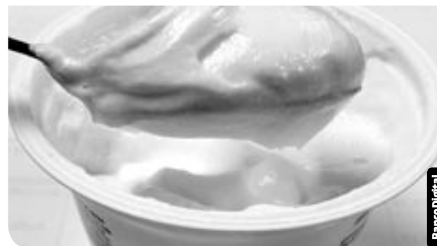
Los lácteos probióticos afectan menos a las personas con intolerancia a la lactosa.

Durante la sesión semanal de actualización del co-