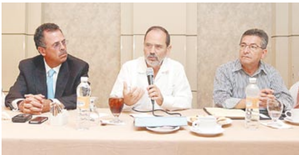
Gustavo Madero se reunió ayer con militantes del PAN y líderes empresariales.