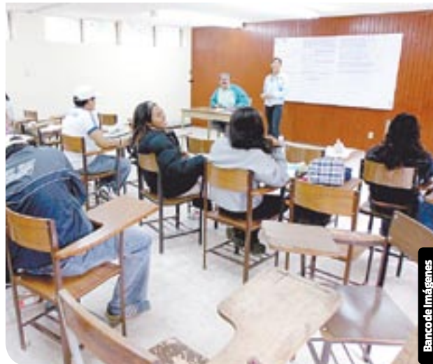
Alumnos de bajos recursos desertan por la falta de dinero.

“Si bien los datos demuestran que el factor económico es importante,