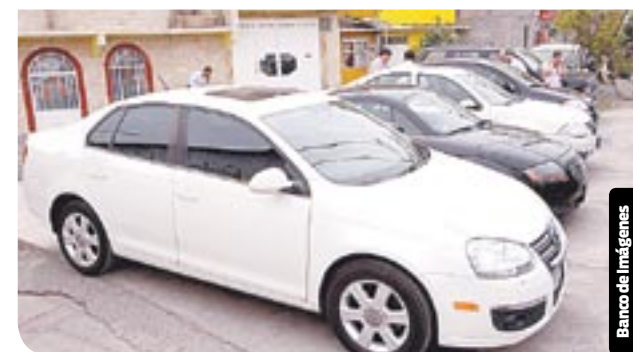
La internación de vehículos provenientes de Europa aumenta.