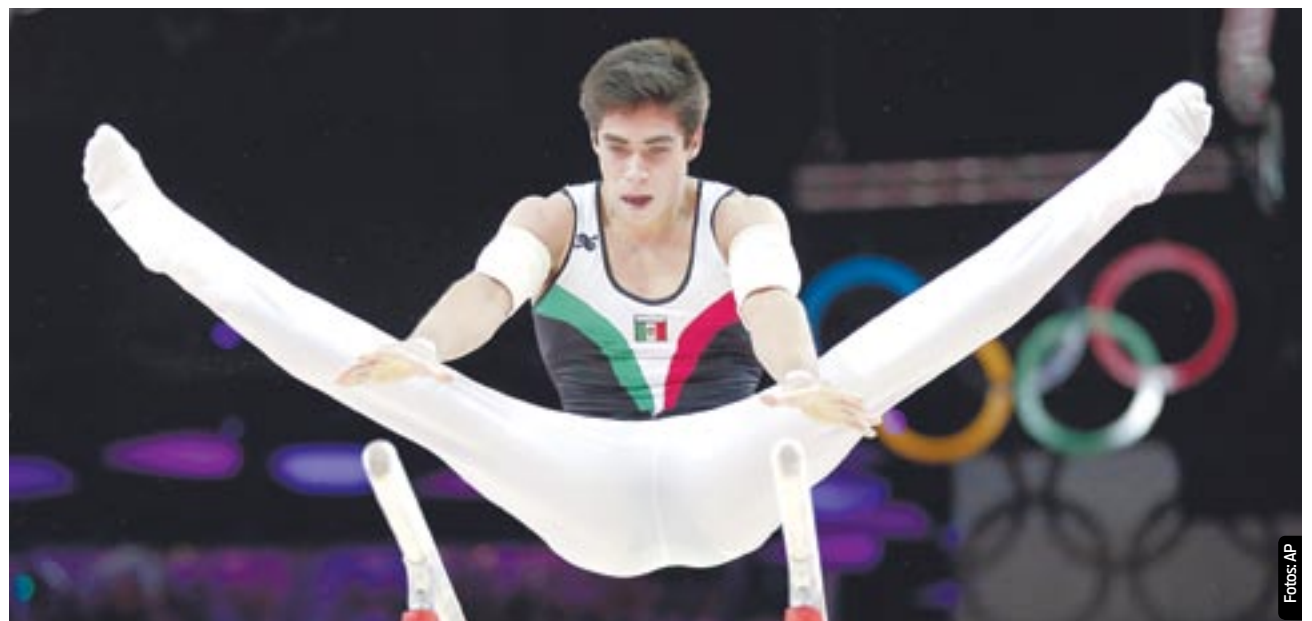
Corral hizo historia al participar en una final olímpica de gimnasia.