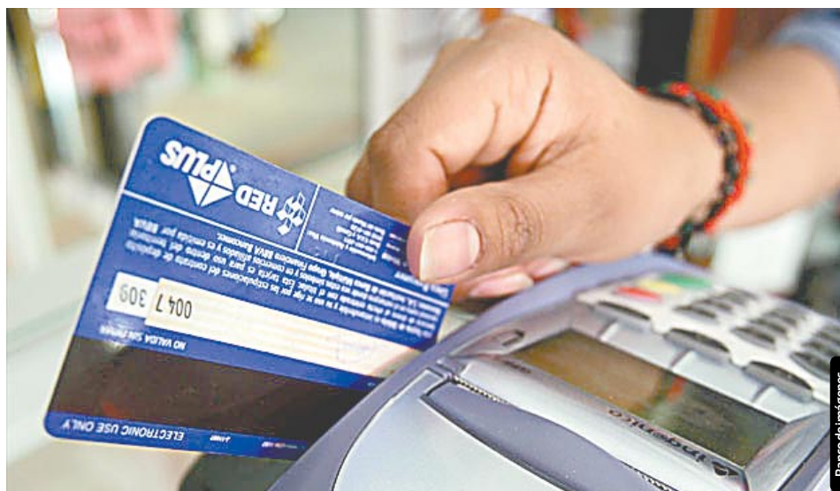
En mayo, la banca comercial registró una morosidad tradicional en tarjetas de crédito de 4.82% en sus balances financieros.

Banco de México ha reconocido que ésta es una medida más cercana sobre el nivel de endeudamiento de los hogares, que siguen teniendo la deuda, sin importar quién posee el derecho de cobro de esos créditos.