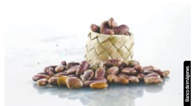
Expertos estiman que la producción seguirá a la baja.