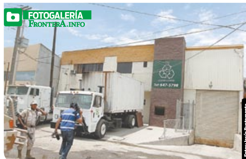
Este "narcotúnel" se ubica en el interior de una bodega que fungía como recicladora.

También se encontraron en la empresa dos tractocamiones y diversas