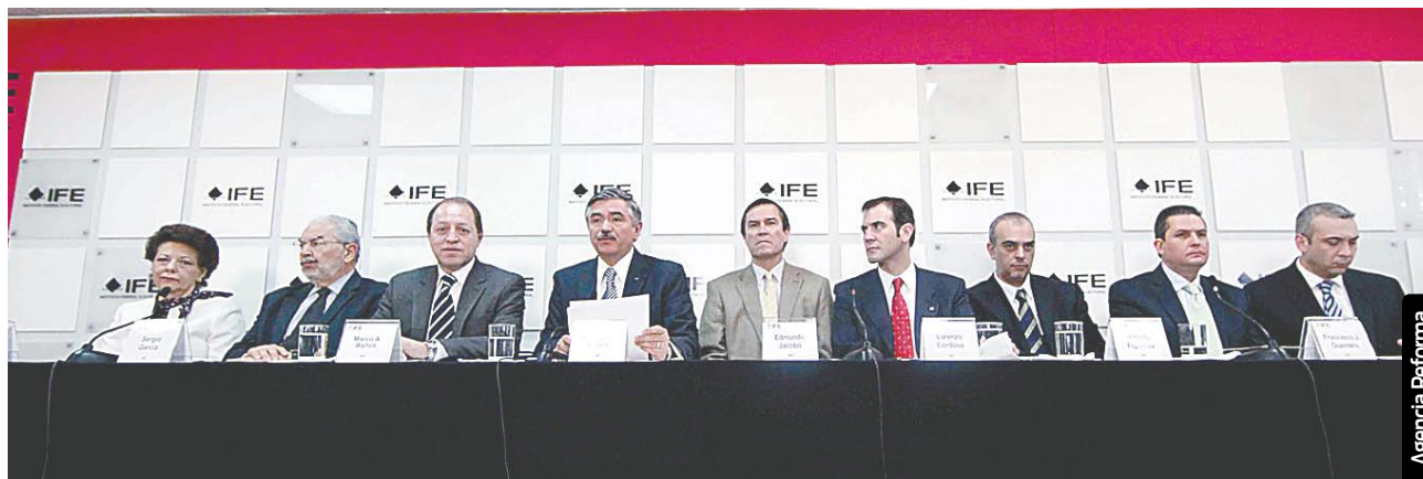
El IFE aseguró que la fiscalización de los recursos de los partidos políticos se lleva a cabo con apego a la ley.