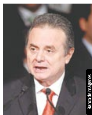
Pedro Joaquín Coldwell.