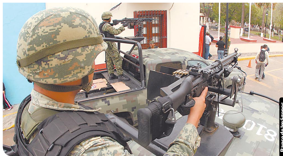
El Ejército realiza patrullajes en Tamaulipas, pero la violencia no ha podido ser contenida en ese estado.

abandonado en una zona transitada por personas y vehículos, las autoridades decidieron trasladar a otro lugar los restos para contar el número de las víctimas, pero "los primeros informes indican que son 14 cuerpos", dijo la fuente.