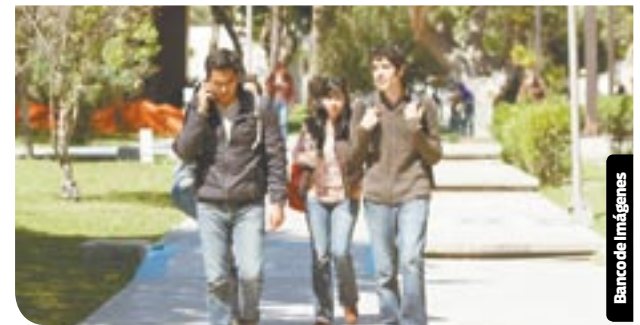
Un poco más de medio millón de los habitantes de Tijuana son estudiantes.

cera generación, empresa especializada en reparación y restauración de relojes monumentales.