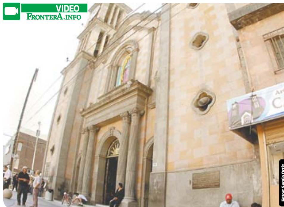
El reloj de la Catedral tiene quince años de no estar en funcionamiento.

tución de tres vitrales, la iluminación interna y externa de catedral.