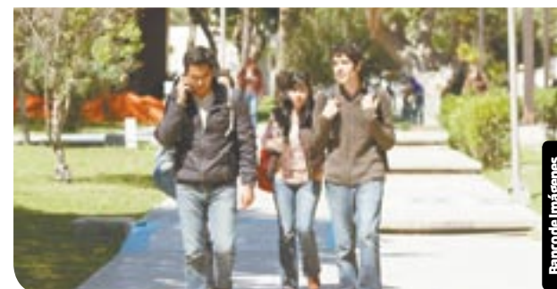
Un poco más de medio millón de los habitantes de Tijuana son estudiantes.

cera generación, empresa especializada en reparación y restauración de relojes monumentales.