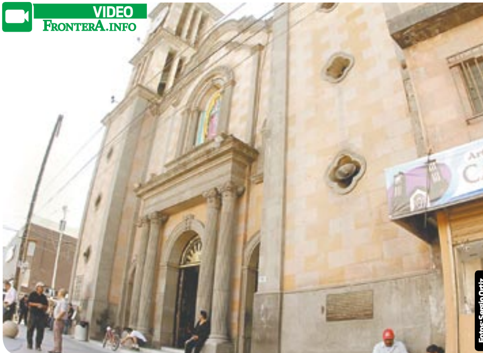
El reloj de la Catedral tiene quince años de no estar en funcionamiento.

tución de tres vitrales, la iluminación interna y externa de catedral.