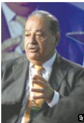
Carlos Slim habló durante la Cumbre de las Américas del WTCC.

“La marca todavía durará otros 100 mil años. México tiene una imagen en el mundo muy positiva, en todos sentidos, en su historia, en su presencia, su cultura...”,