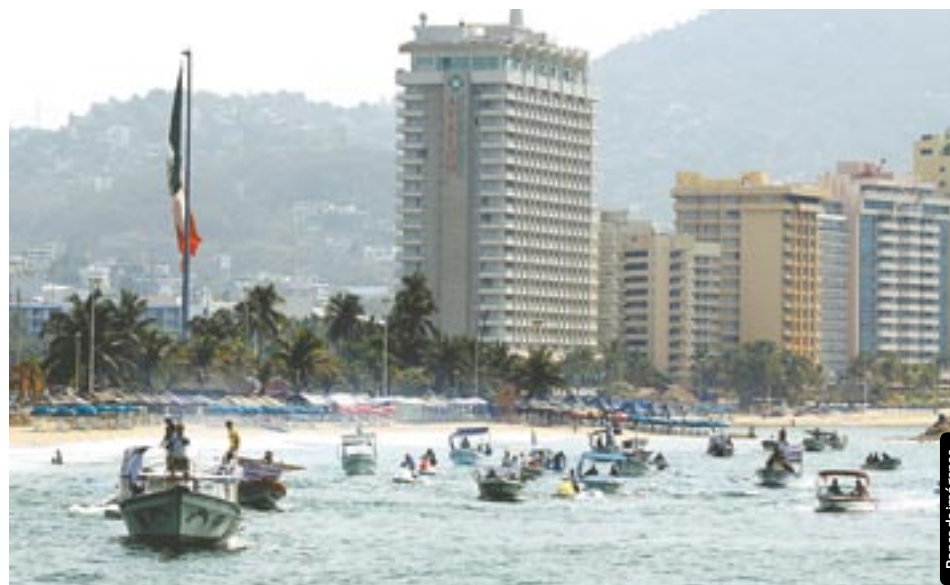
En 2011, 98 millones de personas fueron empleadas en el sector.