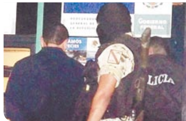
Los detenidos fueron llevados ante las autoridades federales.

Los militares lograron detener en ese momento a los tres ocupantes de la unidad P-5022 que en la parte trasera de la camioneta llevaban una cámara de llanta en donde se en-