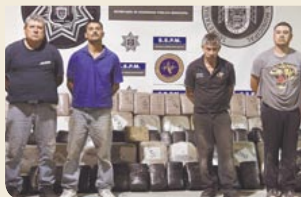
Cuatro personas fueron detenidas en el operativo.