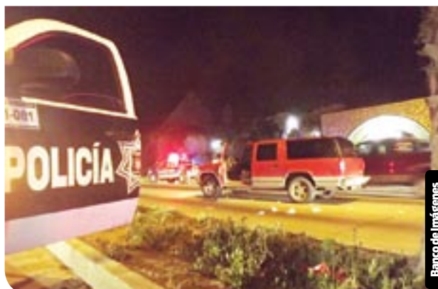
El agente fue asesinado en su vehículo al salir de su turno.

El funcionario destacó que se está trabajando en conjunto con las distintas corporaciones policiacas, en este caso, la Secretaría de Seguridad Pública Municipal (SSPM), para lograr el esclarecimiento del homicidio perpetrado el pasado