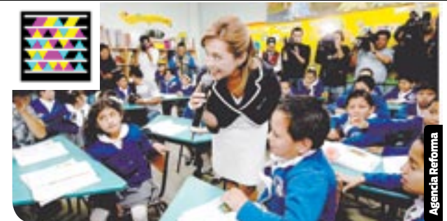
Vázquez Mota visitó ayer una escuela primaria.