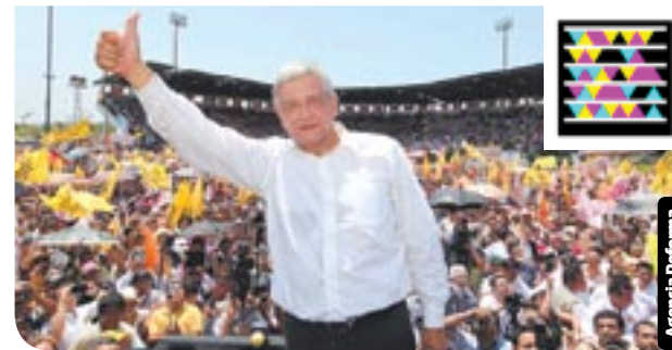
El candidato presidencial estuvo ante más de 4 mil simpatizantes en Coatzacoalcos, Veracruz.

“Hemos cuatro candidatos, tres hombres y una mujer, pero la verdad es que son sólo dos proyectos. Lo digo sin ánimo de lastimar