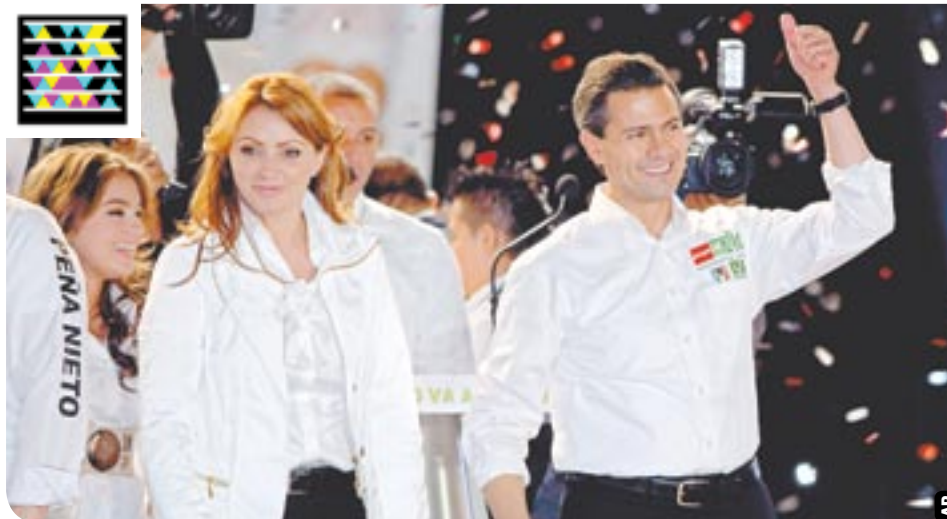
Enrique Peña Nieto estuvo ayer en Guadalajara junto a su esposa, la actriz Angélica Rivera.

Porello, una desus promesas fue que triplicará el índice