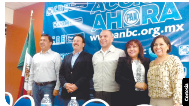
El líder municipal del PAN (centro) dio una rueda de prensa.

El Criterio y actualización del diseño estructural, el Diseño y construcción de cimentación, y el Diseño y construcción de mampostería.