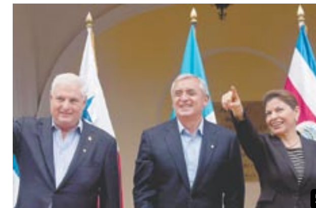
Otto Pérez Molina, presidente de Guatemala (centro).

Pérez Molina, un general retirado del ejército, de 61 años, que llegó al poder con una campaña en la que ofrecía "mano dura" para erradicar la violencia que agobia al país,