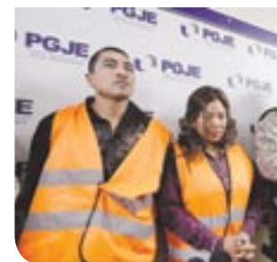
Fueron capturados por elementos de la PGJE.

Luego de una investigación, se realizó un operativo en la delegación La Mesa, donde el plagiario había planeado verse con un familiar del menor para que le entregara solamente 5 mil dólares.