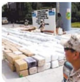
Fueron más de 8 toneladas.

Dos días después, los castrenses, con apoyo de agentes de la Delegación Estatal de la PGR, cumplieron dos órdenes de cateo en diferentes domicilios, en donde hallaron 2 toneladas 82 kilos de mariguana.