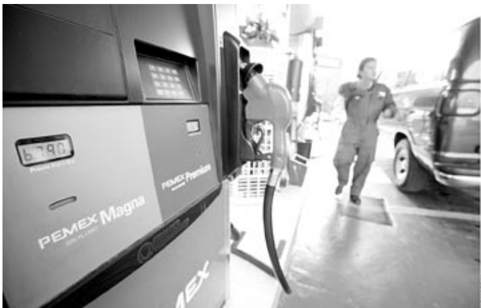
El precio de la gasolina Magna se incrementará hoy en nueve centavos.