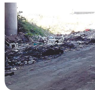
El cuerpo fue ubicado debajo de un puente.

ción de la Procuraduría General de Justicia del Estado, alrededor de las 11:30 horas del sábado se recibió el reporte de un cuerpo calcinado, sobre la vía pública y debajo del puente antes mencionado, en la colonia Valle Bonito de la delegación La Presa Rural.