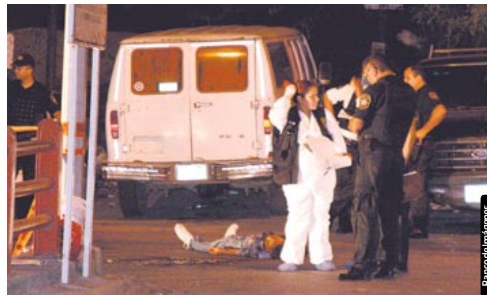
Banco de imágenes

En cuatro casos un grupo criminal dejó mensajes en cartulinas adjudicándose los asesinatos.