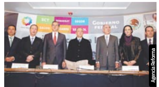
Titulares de las dependencias dieron una rueda de prensa.