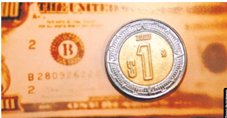
El tipo de cambio podría oscilar entre 12.60 y 13.00 pesos durante el mes.