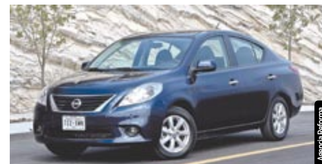
Nissan es la marca que más vendió en México en el 2011.